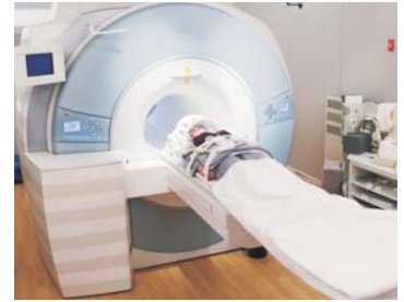
3 テスラ MRI